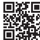
ABB Contact Center tel. 22 223 77 77 www.abb.pl kontakt@pl.abb.com